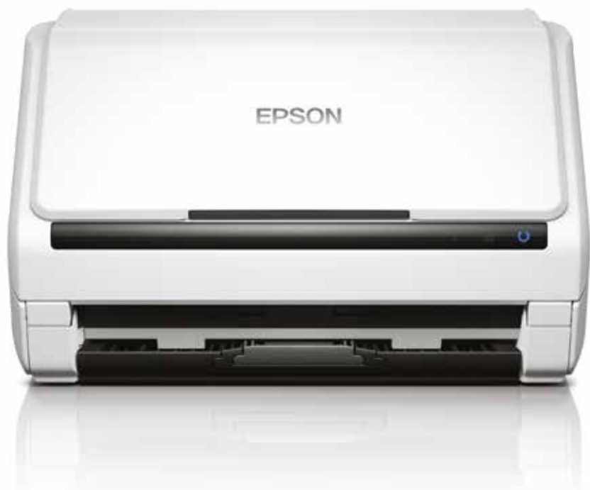
A3 szkennelés: 1 – Az A3-as nyomathordozók tartólappal rendelkező ívlapja

A DS-530 és a DS-570W színes kétoldalas dokumentumszkennerek intelligens választás az üzleti dokumentumkezeléshez, amelyek segítségével gyorsan beolvashatja, indexelheti, tárolhatja és megoszthatja a fontos üzleti dokumentumokat.